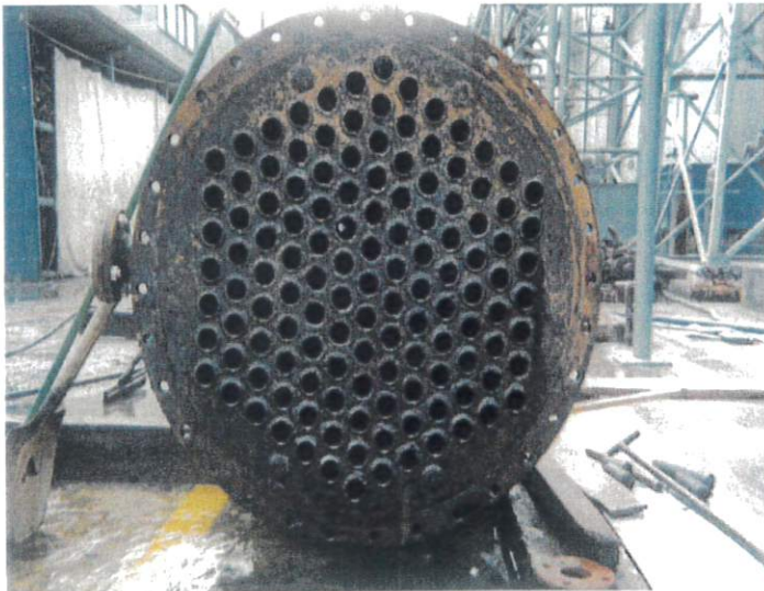
热交交换器 洗净后