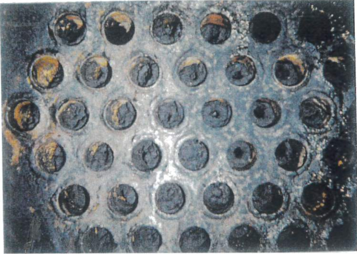
热交交换器 洗净前